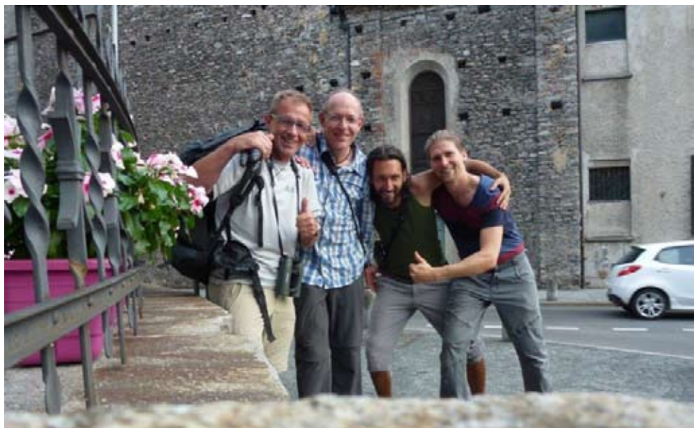
Die «Zug-Vögel» nach erfolgreichem Bird Race