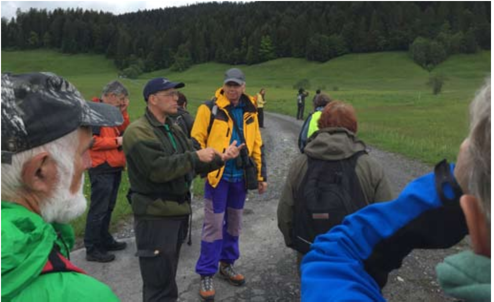
Abschlussexkursion im Hochmoor Rothenthurm