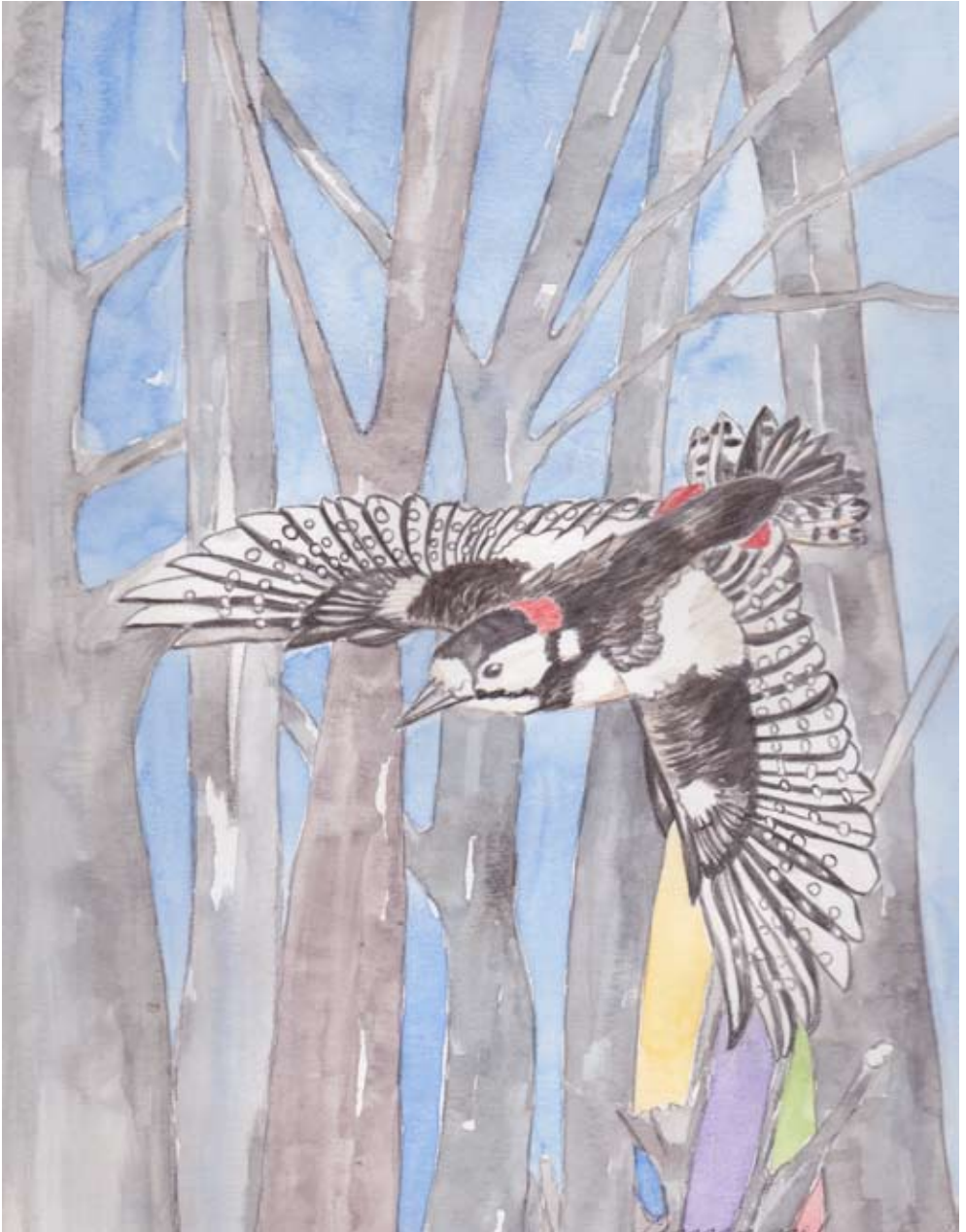
Buntspecht, Vogel des Jahres 2016