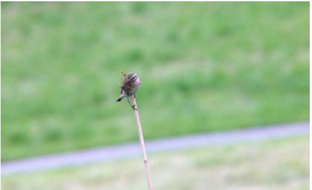
Selten zu beobachten: Braunkehlchen

Wir danken Sales für seinen grossen Einsatz!