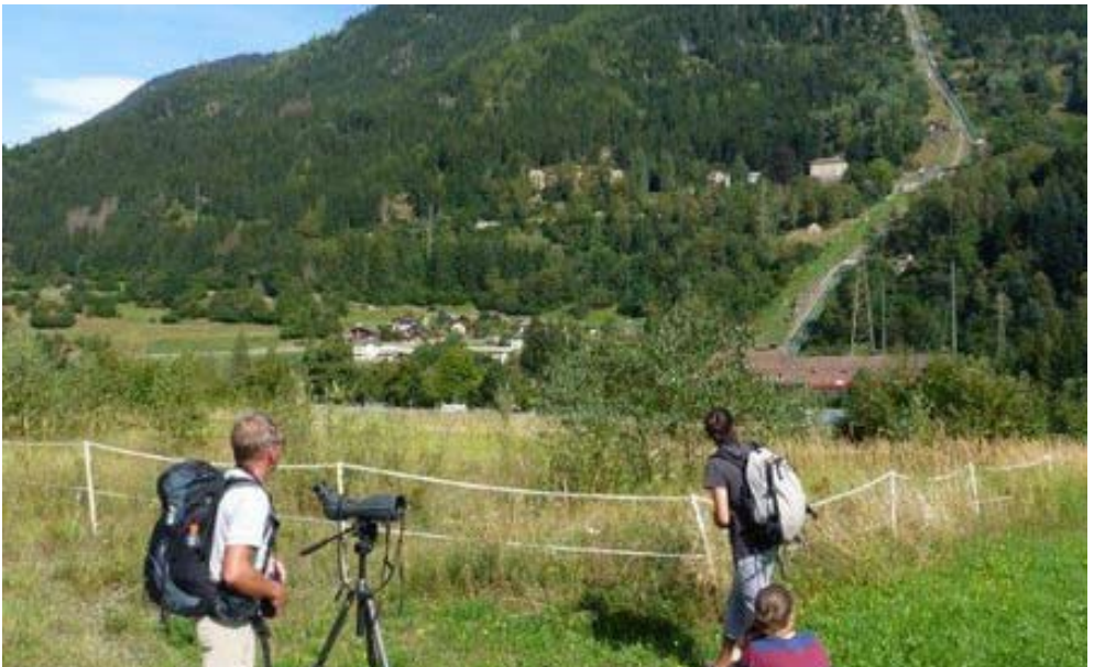
Die «Zug-Vögel» in Ambri mit Blick auf die Ritom-Bahn

entfloh aus nächster Nähe ein Wespenbussard. Am Beobachtungspunkt angekommen, dauerte es ca. 1,5 s bis Peter und Tom Waldrapp und Fischadler entdeckt hatten. Diese beiden (die Befiederten) sorgten in der Folge für Spektakel. So verbrachten wir viel Zeit mit der Betrachtung der Krallen des Adlers, der Angst der Enten und dem farbigen Glanz auf den Flügeln des Waldrapps. Es hat uns besonders gefreut, ihn auf unsere Liste zu setzen, weil wir doch dieses Jahr für seinen Schutz unterwegs waren. Wir insistieren für die Anrechnung dieser Art,